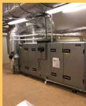
Nya FTX ventilationsaggregat på Knaftvägen 82C, tidigare har vi även bytt på 82A och B.