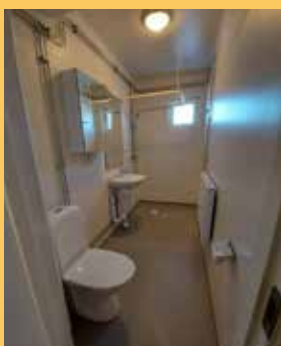
Stambyte Källvägen 2-12 beräknas vara klart under oktober 2021