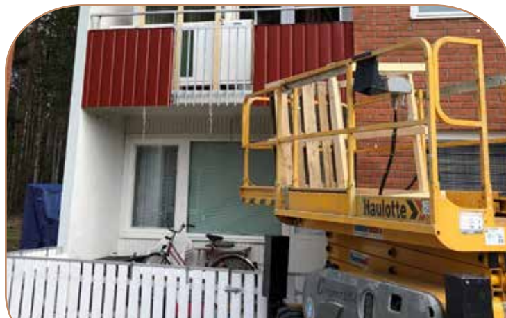
Fönsterbyte Brännbergsvägen 6-22

Furuvik - Industrivägen/Anläggargvägen Hällan - Klippstigen/Bergsstigen Normalm - Envägen (ICA) Hotell Lappland - Endast glas Ansia camping - Endast glas